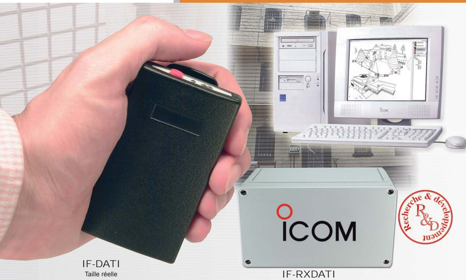
IF-DATI Taille réelle