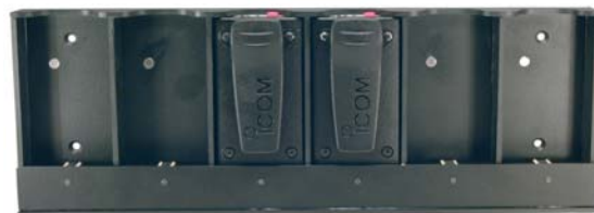
BC-DATI Chargeur pour 6 IF-DATI

Les spécifications et informations données dans ce document peuvent être modifiées sans préavis.