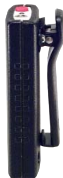
Taille : 8,8 x 4,6 x 1,3 cm Poids : 80g