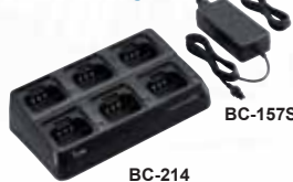
BC-214 Chargeur rapide 6 postes ou batteries