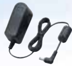
Adaptateur secteur BC-123SE